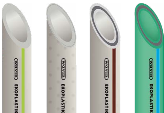
Ekoplastik EVO PP-RCT