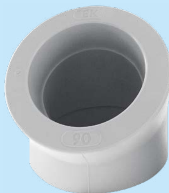
Cot 45°, 90 mm, PPR

Rezistența ridicată a materialului PP-RCT, permite o reducere a grosimii peretelui.